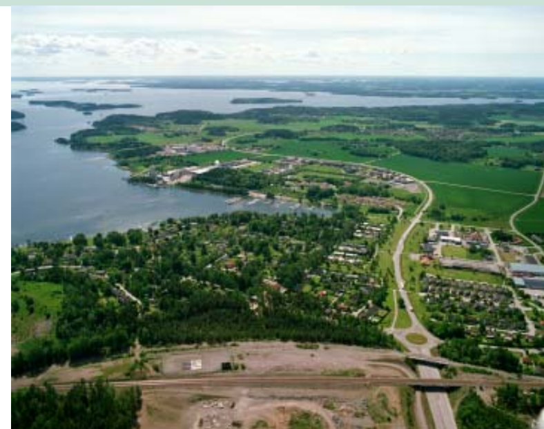
Södra infarten Järnvägens nya sträckning och bro över Kalmarleden nederst i bilden. De skogsklädda moränöarna i landskapet syns tydligt och Mälarens flikiga vikar.