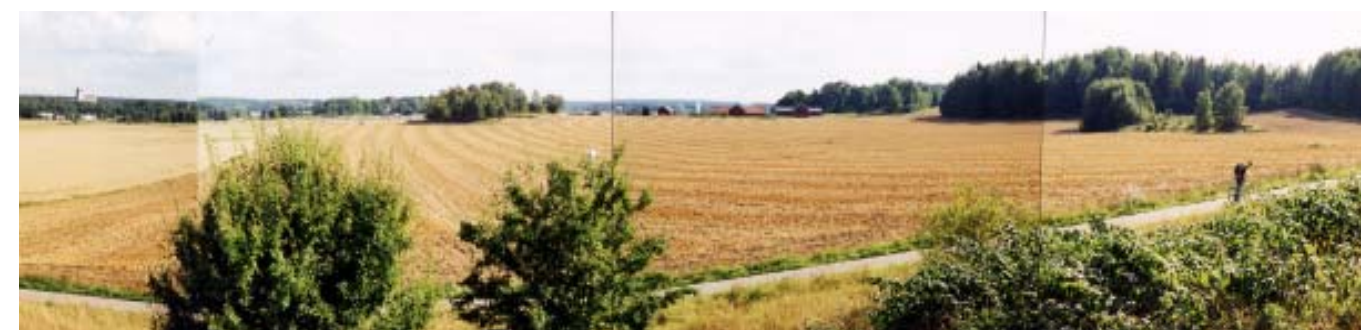
Gröna Dalen söderut mot Väppeby