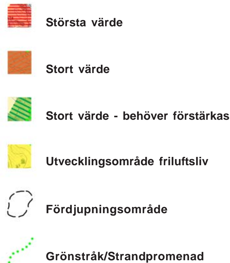
karta 4 Grönstrukturplan analys och värdering