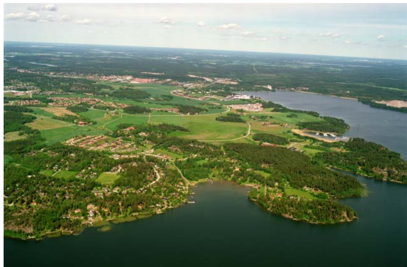
Flygbild mot norr från Norra Björkfjärden

Ekolsundsviken, Norra Björkfjärden och Kalmarviken är vikar av Mälaren.