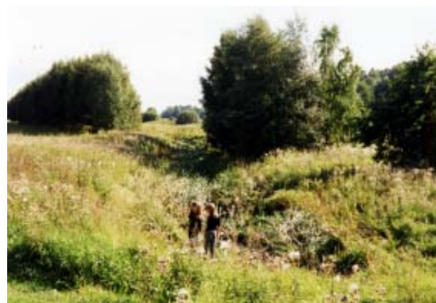
Ån vid Dalängen