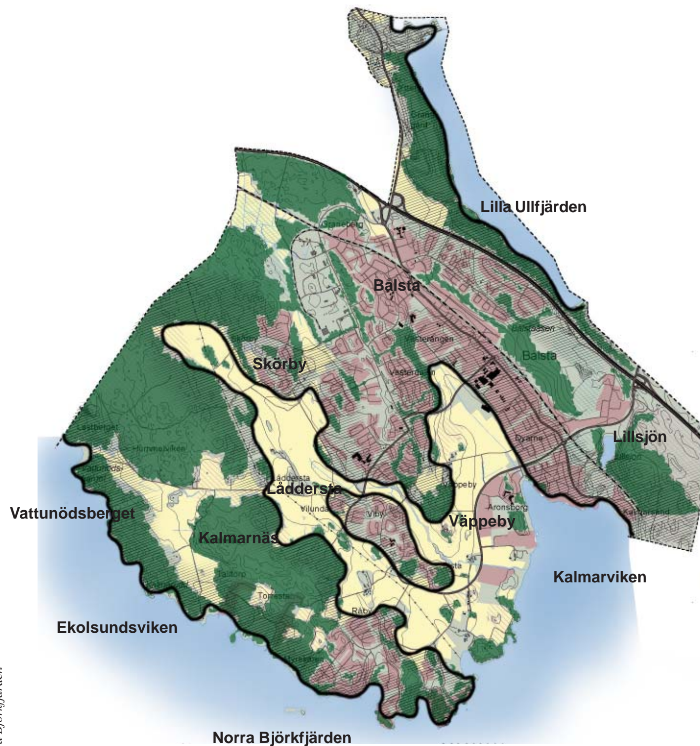
karta 1 Det storskaliga landskapet