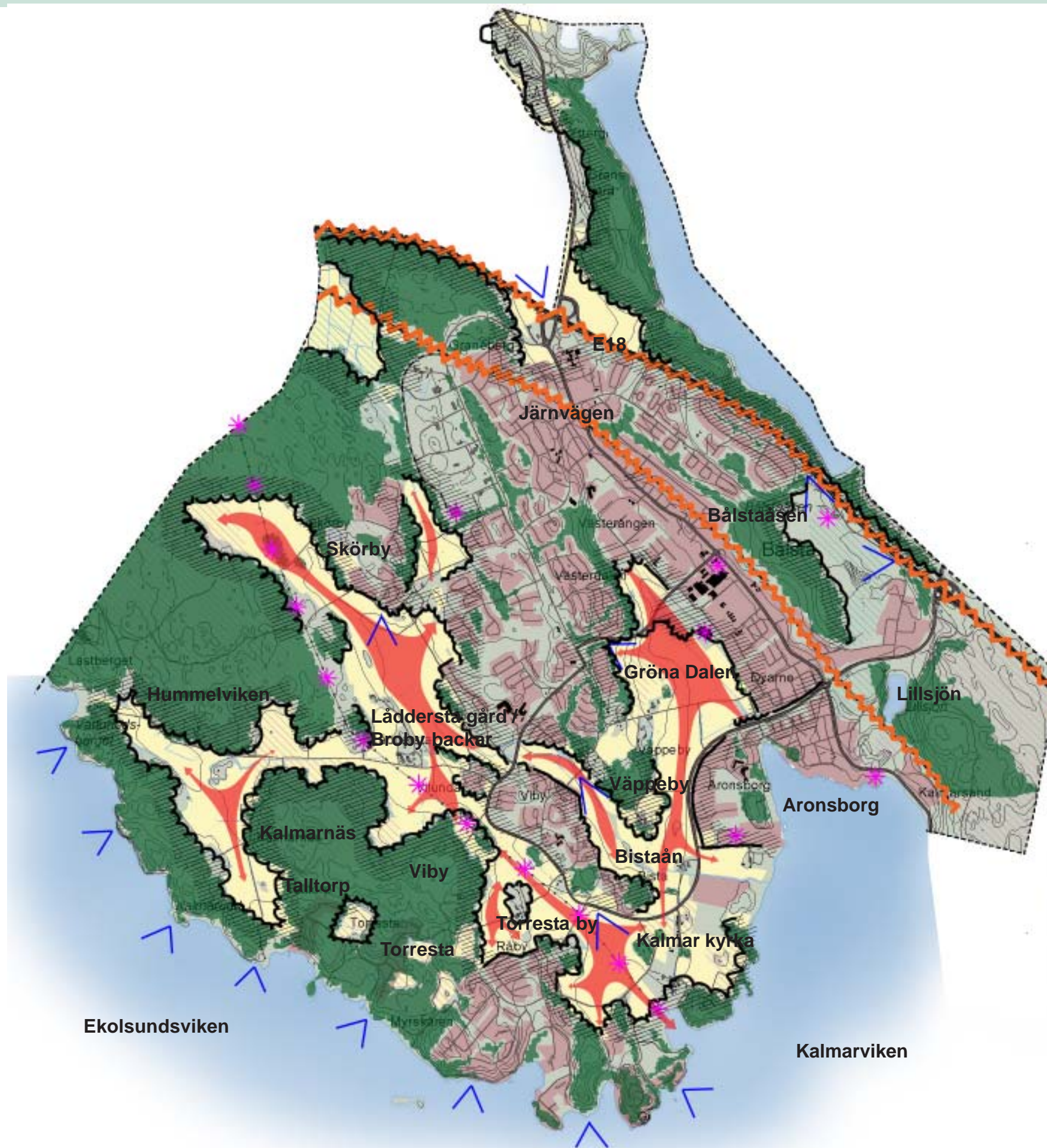
karta 2 Landskapsanalys