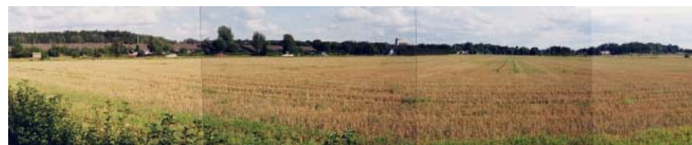
Gröna Dalen mot Mansängen och Dyarnes industriområde