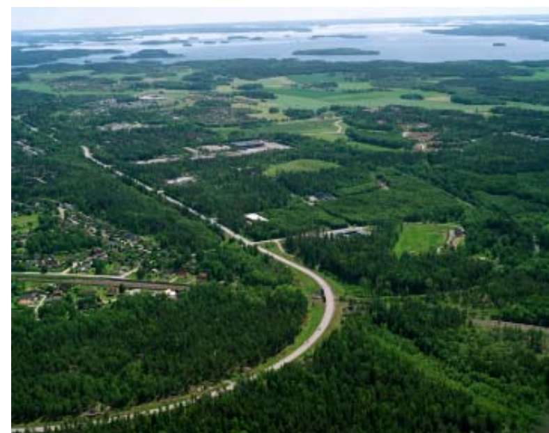
Västerskogs industriområde med den nya förlängningen av Kraftleden i planskild korsning över järnvägen