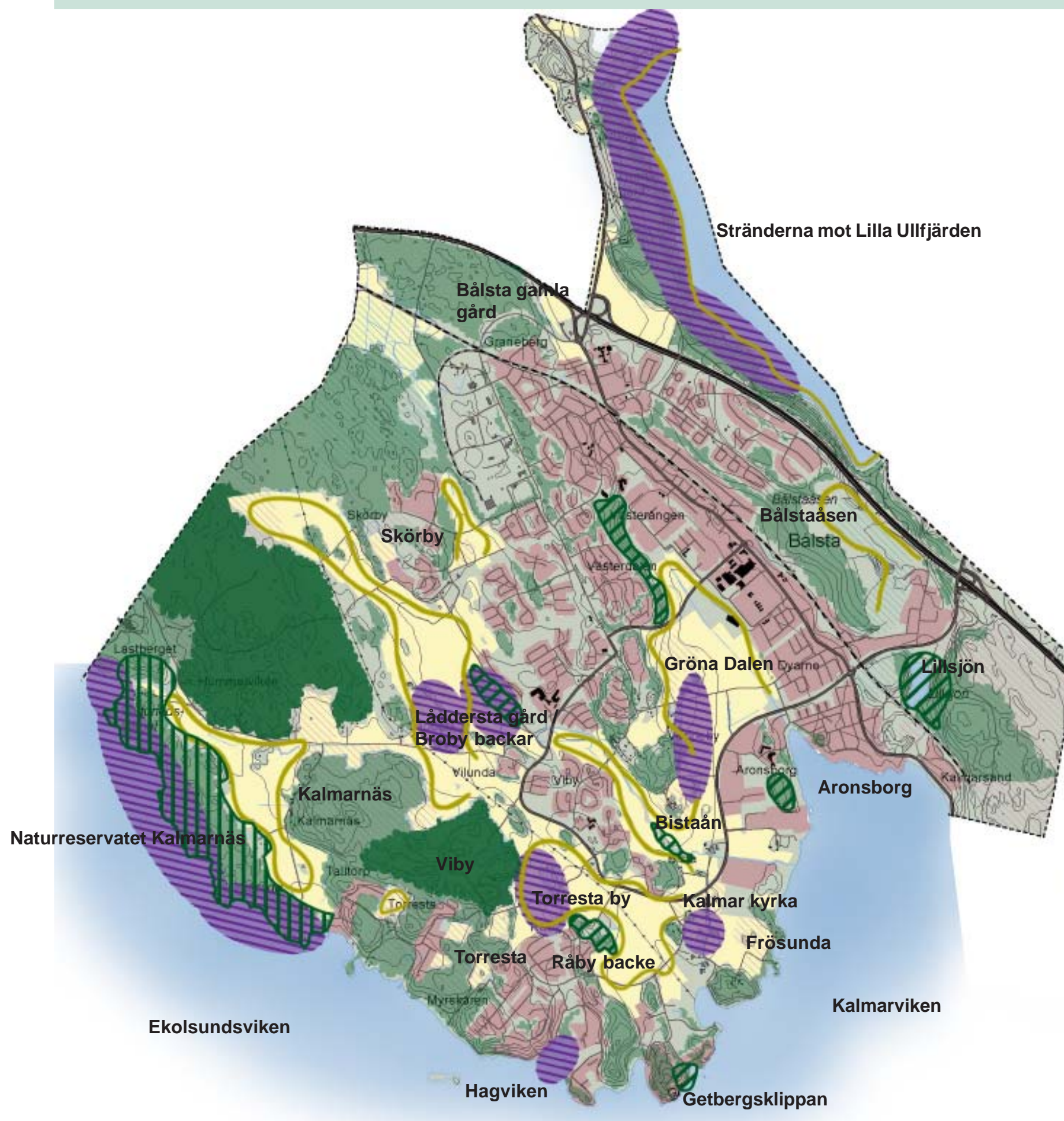
karta 3 Natur och rekreation