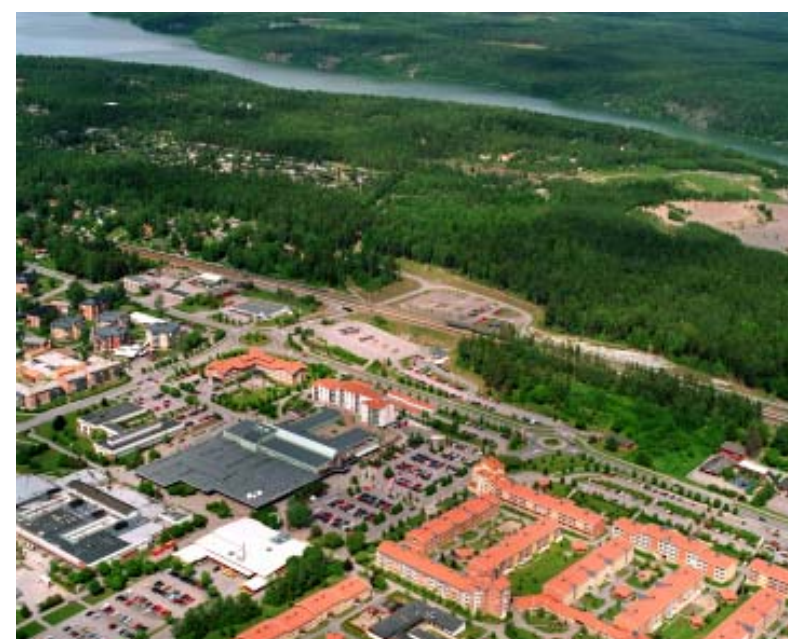
Bålsta centrum Den gamla riksvägen genom samhället har försetts med rondeller. E18:s nya sträckning kan anas i bildens övre kant Bålstaåsen och del av sandtaget till höger.