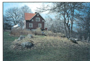
Bilden visar Björkbacken med forngrav i förgrunden