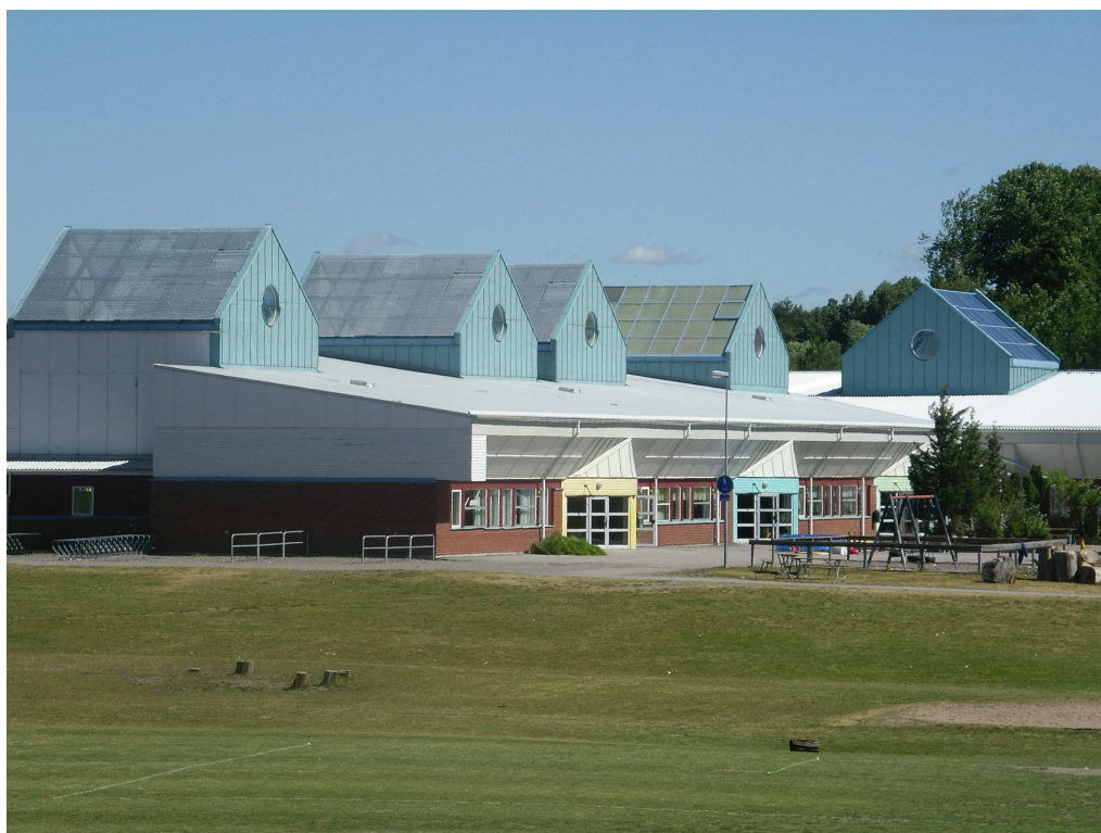
Fotografi på Futurum en av Håbos grundskolor