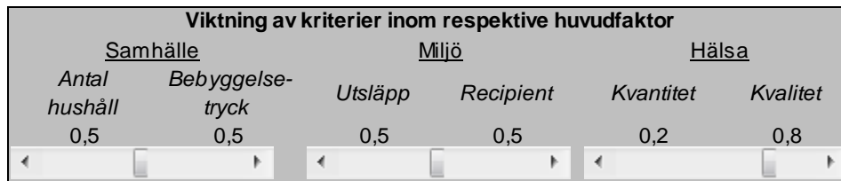
Figur 2: Reglage i prioriteringsverktyget för att justera viktningen mellan de kriterier som ingår i de tre huvudkategorierna samhälle, miljö och hälsa.

i Figur 2. Ursprungsantagandet är att de två kriterier som ingår i varje huvudkategori är lika viktiga och därmed har vikten 0,5. Genom att ändra viktningen kan man dock studera hur resultatet skulle se ut om man t.ex. inte tar hänsyn till ett kriterium (vikt = 0) eller viktar ett kriterium som mindre viktigt än det andra. Vid bedömning av hälsofaktorn har viktningen satts så att kvalitet utgör 80 % av bedömningen. Orsaken är att det i Håbo kommun är ovanligt med begränsningar i kvantitet och en viktning på 50 % ger denna parameter större betydelse än vad som är fallet i verkligheten. En viss viktning för kvantitet (20 %) bedöms dock vara motiverat.