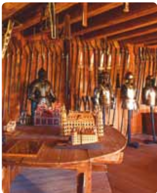
Wrangels Rustkammare.

Det var här greve Carl Gustaf Wrangel uppförde Skoklosters slott under den svenska stormaktstiden på 1600-talet. Slottet är unikt med sina samlingar och är lika känt internationellt som i Sverige. Guidade visningar bland de 50 000 föremålen och ett besök i specialutställningen gör ditt besök oförlömligt. Fri entré till slottets bottenvåning med utställningar.