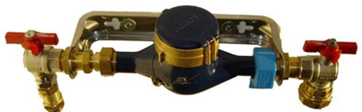
Vattenmätare i konsol och avstängningskranar.