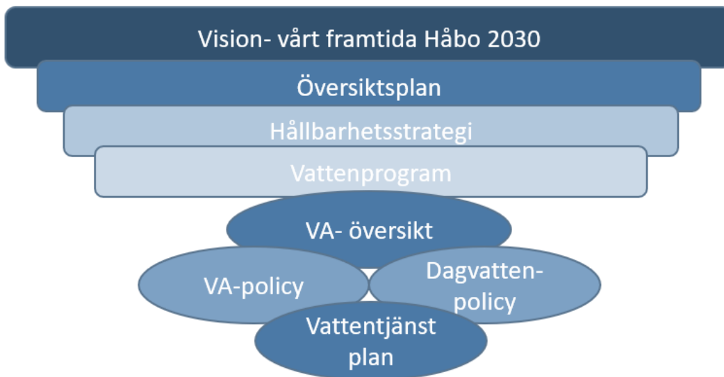
Figur 1. Beskrivning över styrdokument som ingår i kommunens VA-planering

Tidigare VA-plan och dess innehåll ersätts av denna vattentjänstplan i sin helhet och kompletteras med nytt innehåll.