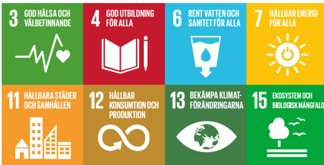
Figur 3. Åtta globala mål som utpekats som mest relevanta i Håbo kommuns hållbarhetsstrategi.

Hållbarhetsstrategin pekar ut åtta globala mål som de mest relevanta för Håbo kommun. Se figur 4. Även om dessa åtta målen är specifikt utpekade så behöver kommunen arbeta med samtliga globala mål eftersom de överlappar varandra.