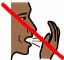
Hosta inte i händerna