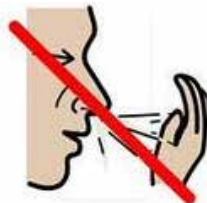
Nys inte i händerna