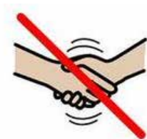
Ta inte i hand