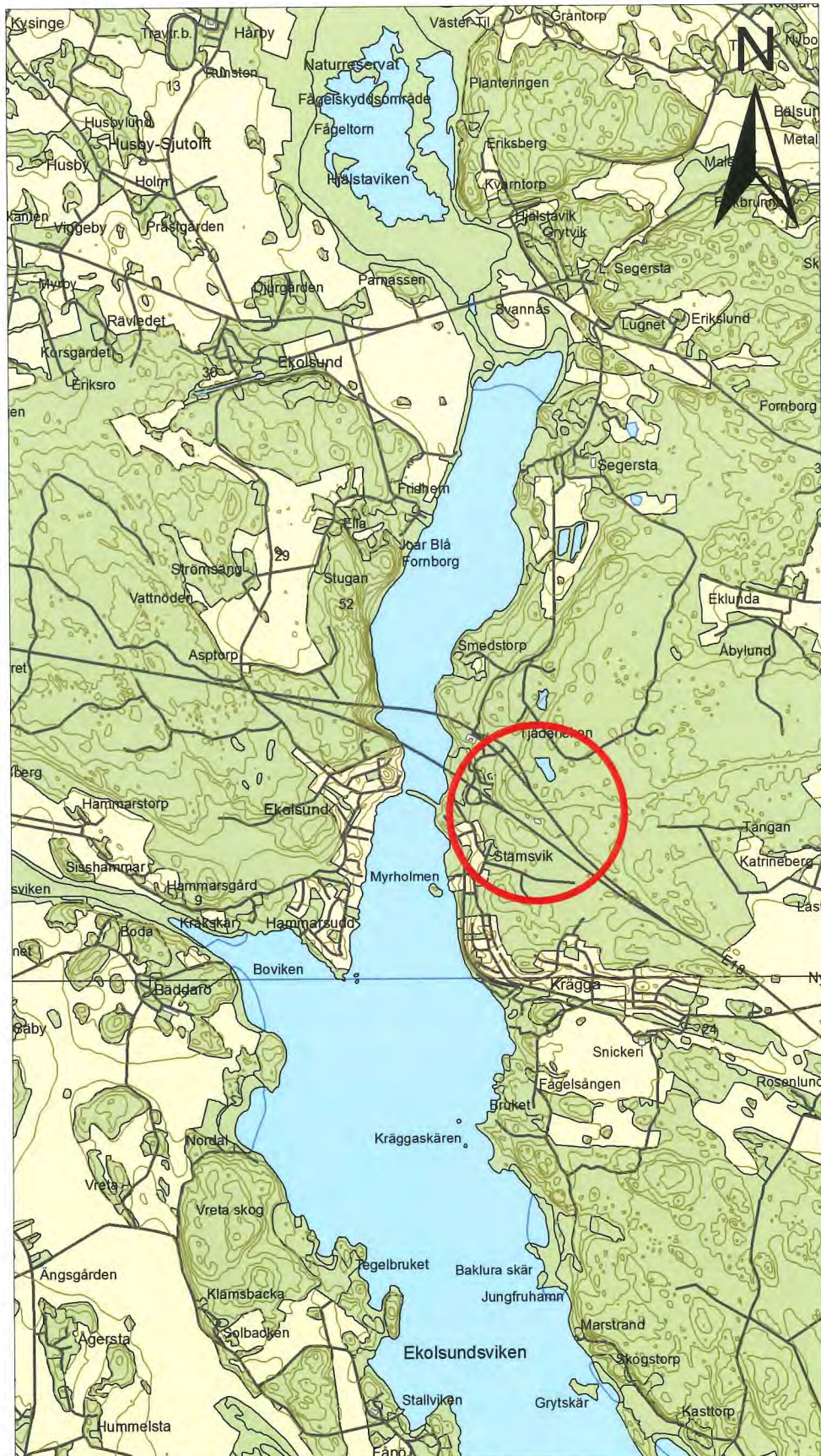
Figur 1. Undersökningsplatsens läge, markerat med en cirkel. Utdrag ur digitala Terrängkartan. Skala 1:50 000.