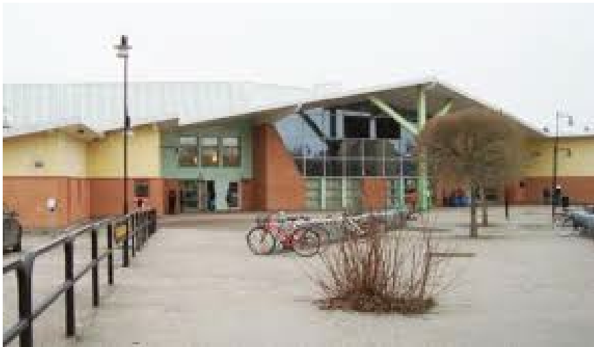
På skolans framsida finns parkeringsplatser för cyklar, sparkcyklar mm.

Skolans läsårs mål är ökad behörighet till gymnasiet. Att skaffa sig en utbildning är en friskfaktor för ett friskt och hållbart liv som vuxen. För att nå dit behöver vi skapa förutsättningar för ökad delaktighet, se till att eleverna har god närvaro i skolan och förebygga frånvaro i samråd med vårdnadshavare. Det gör vi genom olika handlingsplaner och rutiner samt genom olika möten där vi kan samverka. Kommunen har tagit fram ett gemensamt förväntansdokument på vad skolan förväntar sig av dig som vårdnadshavare. Detta för att vi tillsammans ska kunna skapa de bästa förutsättningarna för ert barns lärande i skolan. Ni hittar det på kommunens hemsida .